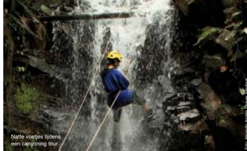
Natte voetjes tijdens een canyoning tour

Ik eindigde mijn reis in dit fijne hotel in een leuke